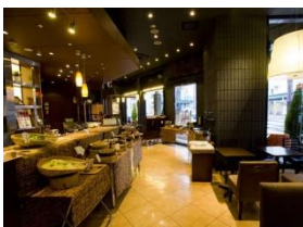
朝食会場 (1F カフェ)