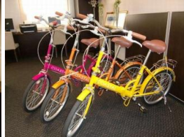
レンタルサイクル